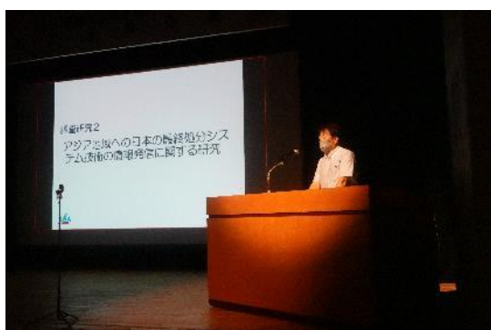
調査研究 2 アジア地域への日本の最終処分システム技術の情報発信に関する研究