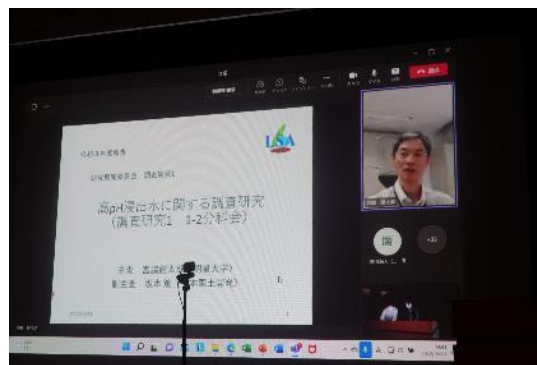
調査研究 1-2 高 pH 浸出水に関する調査研究