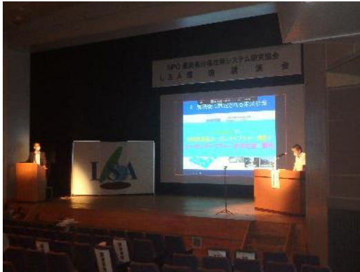
講演後の質疑応答