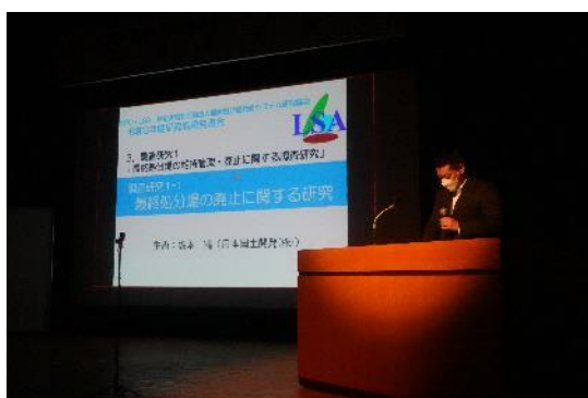
調査研究 1-1 最終処分場の廃止に関する研究