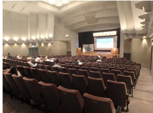
つつじホール全景