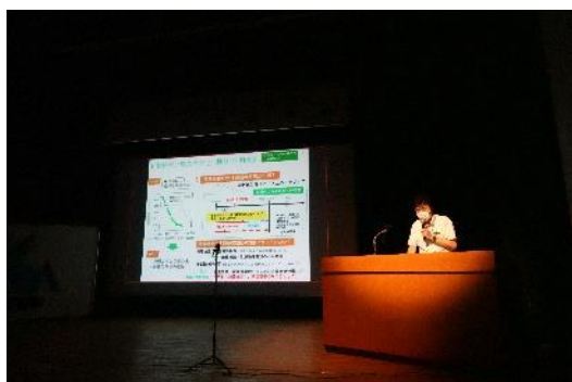
特別研究 A 廃棄物最終処分システムのDXとGXに関する研究